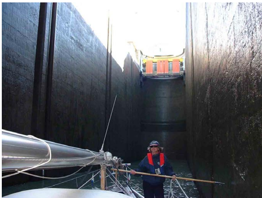
Ecluse de Bollène i Rhône- 23 m

Slussarna har inte vållat oss några bekymmer utom att vi blev lite överraskade av en hög uppåtssluss i Julianakanal där det var långt mellan förtöjningarna. Det gäller här att fästa både för- och aktertamp i samma pållare som automatiskt följer vattenytan. Samma förfarande gäller i slussarna i Saone och Rhone, den högsta är 23 m. I Saone och Rhone är det obligatoriskt att ha flytväst på. Flera mindre kanaler har automatiska slussystem som fungerar mycket bra eftersom man då tar det i sin egen takt. Bra att ha är slussbräda eftersom vissa slussar har vatten upp till kajkanten.